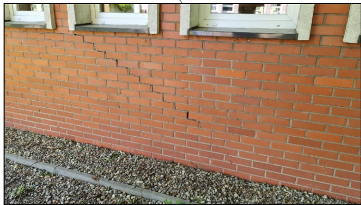
pęknięcia na elewacji północno-wschodniej