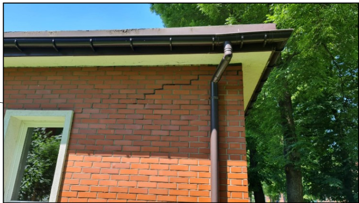
pęknięcia na elewacji południowo-wschodniej